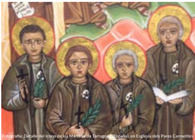
Fotografía: Detalle del Icono de los Mártires de Tarragona (España), en Iglesia de los Pares Carmelitas